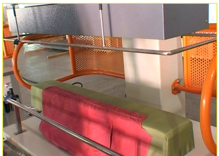
CF-8133 工作中 In working