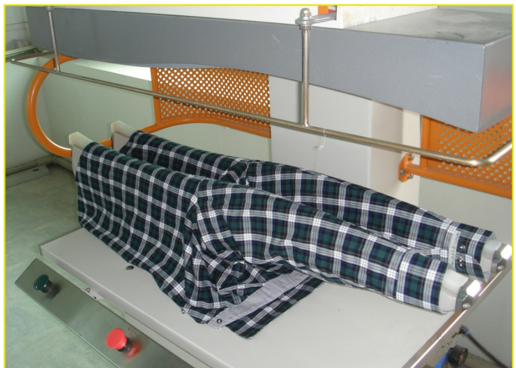
CF-8132 工作中 In working